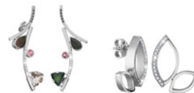
KTERÁ JE ODVÁŽNÁ A KRÁSÁ