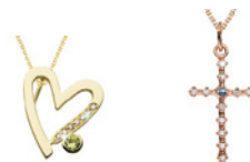
KTERÁ JE PŘÍSTAVEM LÁSKY, VÍRY A NADĚJE