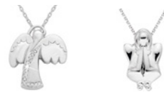
KTERÁ JE ANDĚLEM