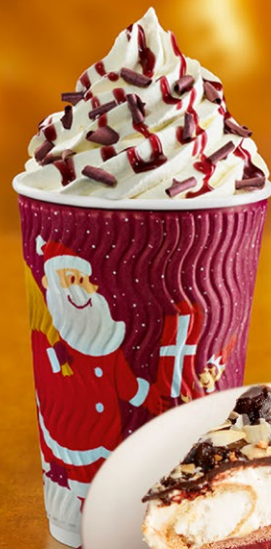
Višňová horká čokoláda

Štěstí, zdraví, pokoj svatý višňujeme vám